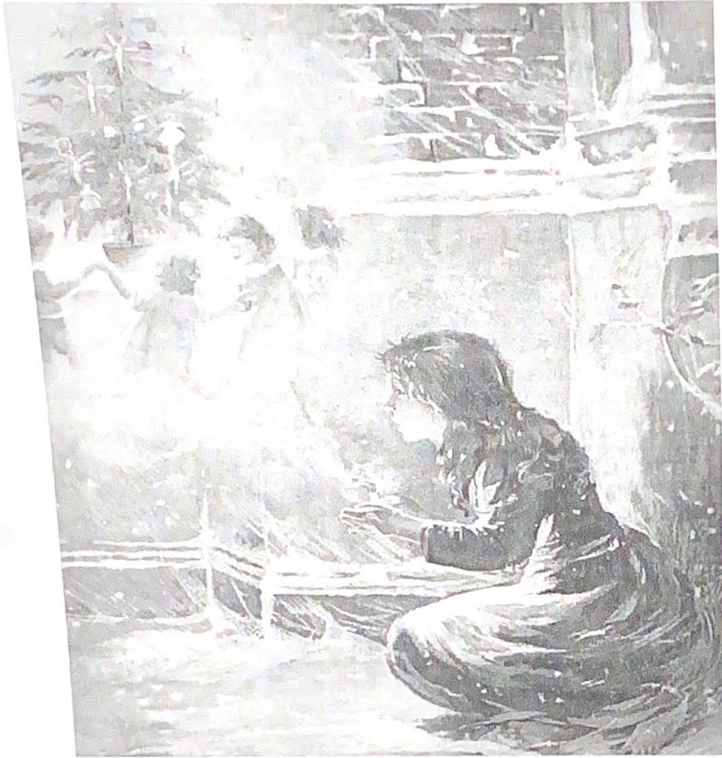
Итоговая таблица выполнения олимпиадной работы